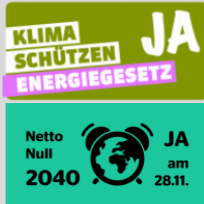
Sujet der Fahnen

Des Weiteren haben wir noch Fahnen, die du bei uns beziehen kannst. Bitte melde dich im Sekretariat der Grünen Winterthur. Wir bringen dir die Fahnen auch gerne vorbei und helfen bei der Montage.